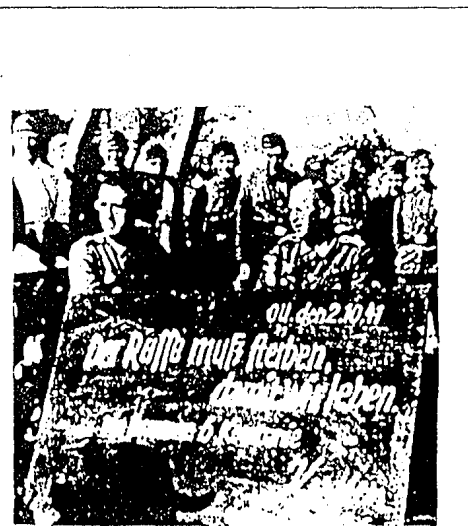
"Русскому приходится смерть, с этим мы живем" — боевой клич фашистского Вермахта при нападении на социалистический Советский Союз Сталина

Сегодня эти пропаганда из фабрики лжи антикоммунизма снова подогреваются, чтобы очернить справедливый характер войны для Советского Союза Сталина. При этой западно/