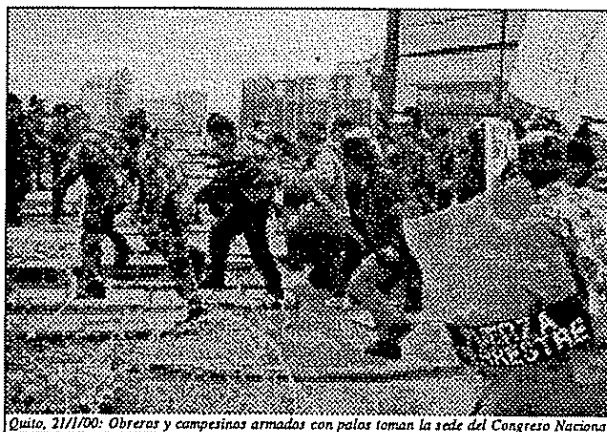
Quito, 21/1/00: Obreras y campesinas armadas con palos toman la sede del Congreso Nacional