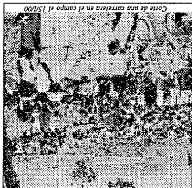
Corte de una carretera en el campo el 15/100