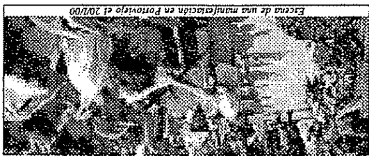
Escena de una manifestación en Portoviejo el 20/100