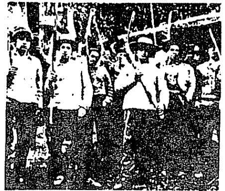
Agricultores y campesinos chilenos ocupan las tierras de un terrateniente durante la época de Allende. El P" C" de Chile condenó las ocupaciones como "ilegales" y votó contra el armamento de las masas populares.

"Chile: ¡Invertir ahora!", así se dijo entonces en un anuncio del FAZ, aparecido el 21. de septiembre de 1973, lo días después del golpe.