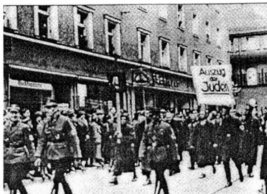
Deutsche Bevölkerung in den Straßen von Regensburg beobachtet die Deportation jüdischer Männer ins KZ Dachau, 10.11.1938