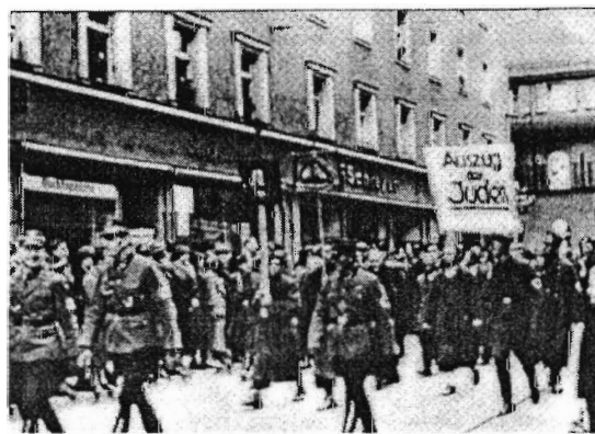
Deutsche Bevölkerung in den Straßen von Regensburg beobachtet die Deportation jüdischer Männer ins KZ Dachau, 10.11.1938