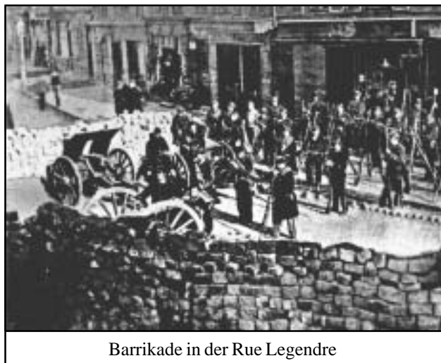
Barrikade in der Rue Legendre

Die Kommune hat nicht nur den erfolgreichen Versuch unternommen, den Beamten-, Militär-, Justiz- und Polizeiapparat, den gesamten bürgerlichen Staatsapparat zu zerschlagen. Die Kommunardinnen und Kommunarden hatten vor allem auch die Aufgabe in Angriff genommen, den alten Staat durch einen neu aufzubauenden revolutionären Staat zu ersetzen. Dieser neue Staatstypus sollte den werktätigen Massen als ein Mittel zur Ausübung einer wirklichen Demokratie dienen, ein Leben ohne Ausbeutung und Unterdrückung begründen. Die Kommune sollte, wie Marx betonte, „als Hebel dienen, um die ökonomischen Grundlagen umzustürzen, auf denen der Bestand der Klassen und damit der Klassenherrschaft ruht“ (Marx, „Der Bürgerkrieg in Frankreich“, MEW 17, S. 342, bzw. MEAS I, S. 494).