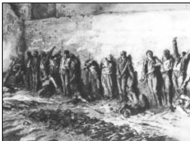
Massenerschießungen durch die Konterrevolution auf dem Friedhof Père-Lachaise am 28. Mai 1871

Auf sozialem und wirtschaftlichem Gebiet hat die Pariser Kommune sofort einige Maßnahmen im Interesse der werktätigen Massen getroffen, die programmatisch teilweise proletarischen Charakter hatten,