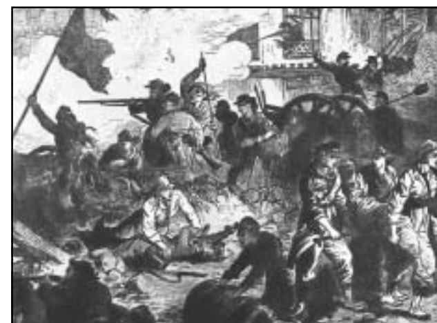
Revolutionäre Frauen verteidigen die Barrikade auf der Place Blanche

(Lenin, „Das Militärprogramm der proletarischen Revolution“, 1916, LW 23, S. 77)