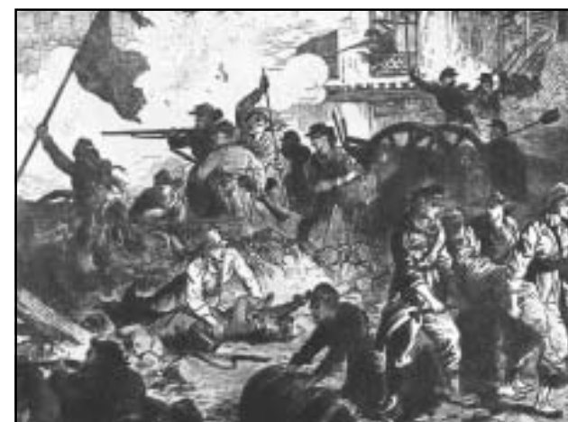
Revolutionäre Frauen verteidigen die Barrikade auf der Place Blanche

(Lenin, „Das Militärprogramm der proletarischen Revolution“, 1916, LW 23, S. 77)